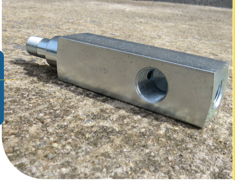
* Acessório de manômetro - Série TGA