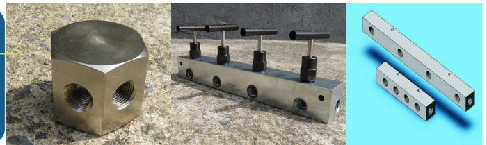
■ Distribuidores de mangueiras das mais variadas formas, entradas e saídas.

Manifolds Máxima pressão de trabalho: 700Bar